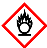
GHS03 Flamme über einem Kreis